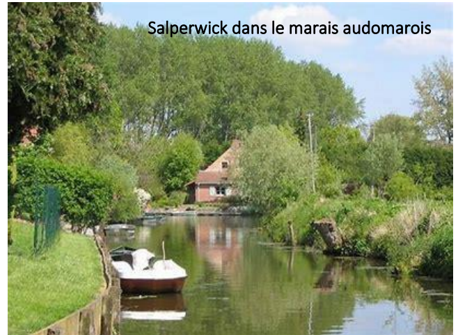
Salperwick dans le marais audomarois

Vers 17h30 retour au camping pour le dernier pot de l'amitié vers 18h30