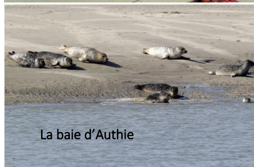
La baie d'Authie