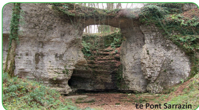
Le Pont Sarrazin